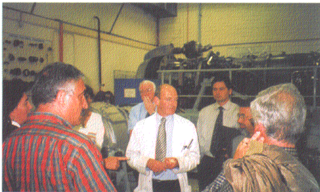
Visita a Centro de Formação Profissional

um grupo de 12 representantes de entidades parceiras do PTE, e por um estágio de uma semana, proporcionado a dois dos técnicos presentes, realizado naquela Agência, e que decorreu entre 23 e 29 de Agosto. A delegação do PTE foi composta por dois representantes do Conselho de Administração da Associação de Municípios e por técnicos, ou responsáveis, das Câmaras Municipais de Felgueiras e de Lousada, dos Centros de Emprego de Felgueiras e de Penafiel, do C.A.E. Tâmega, da Associação Comercial e Industrial de Penafiel, da Associação Empresarial de Paços de Ferreira, da Associação Comercial e Industrial de Felgueiras, da Escola Profissional de Felgueiras, e do Gabinete do PTE.