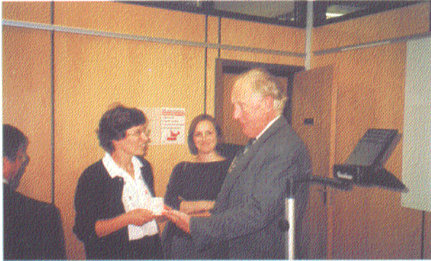
Encontro com o PTE de Limerick

porque a quantidade de problemas que decerto vamos encontrar pelo caminho é enorme. Poderemos ser capazes de inverter este pensamento? Porque não procurar bons projectos que possam ser concretizados e à medida que se vão construindo vão-se ultrapassando as dificuldades que surgem?