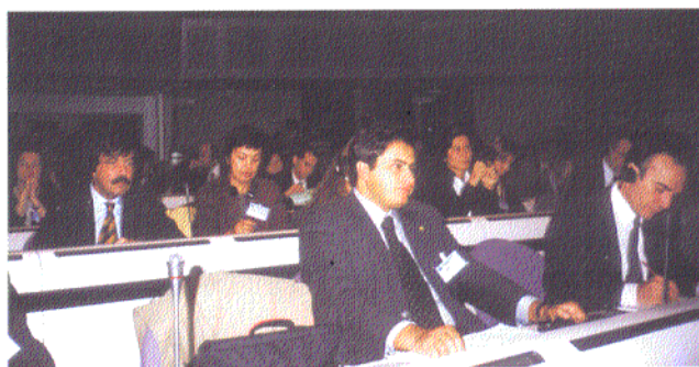
Delegação do PTE

Esta foi uma oportunidade para os responsáveis dos 89 Pactos existentes poderem trocar experiências e reflectirem sobre as diversas metodologias de intervenção adoptadas, e para efectuar um balanço do percurso percorrido e lançar as linhas de orientação para o futuro, tendo em vista a estruturação dos futuros programas estruturais comunitários.