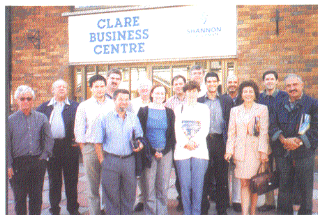
Delegação do PTE

iniciativas às necessidades e às dinâmicas locais; difusão de informação relevante e de "boas práticas"; e, promoção do trabalho em parceria.