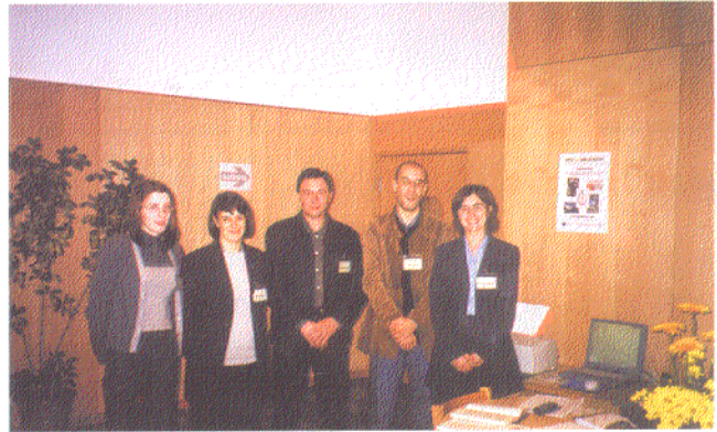
Equipa do Secretariado